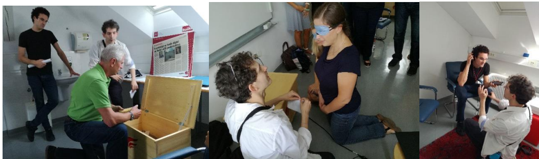
Slike: Multisenzorno iskanje idej na izziv, 2-dnevna Torch delavnica v organizaciji SPIRIT-a, 13. in 14. september 2018 v Ljubljani

Torch metoda je uporabna tako v učilnici med dijaki in študenti kot tudi v gospodarstvu in za osebno in poklicno življenje. Ustanovitelj metode Javier Ideami meni, da prav tako kot treniramo naše telesne mišice in analitične možgane, tako moramo trenirati ustvarjalno mišico. Pravi, da se ni dobro zanašati le na verbalno podajanje snovi, saj s tem aktiviramo le analitične mišice. Vsak izmed nas ima različne vrste inteligentnosti, zato je potrebno ljudi spodbujati k multisenzornim in multidisciplinarnim načinom dela, k uporabi vizualizacije, razmišljanja v metaforah, prenosu ideje v drugo okolje, anonimni vzorci, emocionalni haikuji, kreativni tehniki prisilnih povezav in drugih tehnik in strategij. Te strategije sicer niso povsem nove, so pa prvič zbrane v tehnološkem orodju in metodologiji Torch.